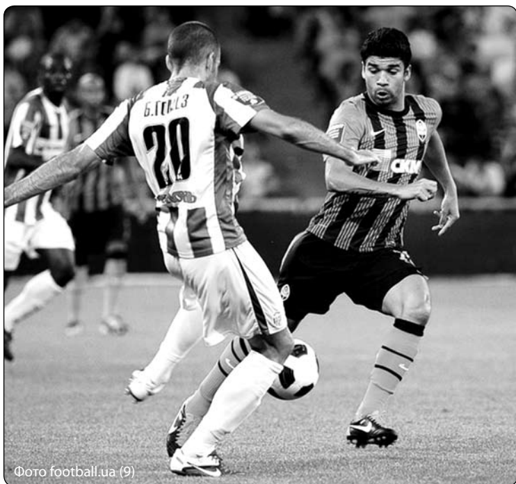
Фото football.ua (9)

НЕЗВАЖАЮЧИ НА ЯКІСНУ ГРУ НА ПОЧАТКУ СЕЗОНУ, «КАРПАТИ» НЕ МОЖУТЬ ЗДОБУТИ РЕЗУЛЬТАТ